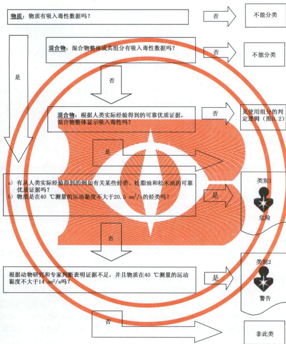
图 B.1 吸入危害判定逻辑