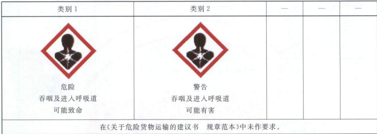
表 C.1 吸入危害的标签要素配置表