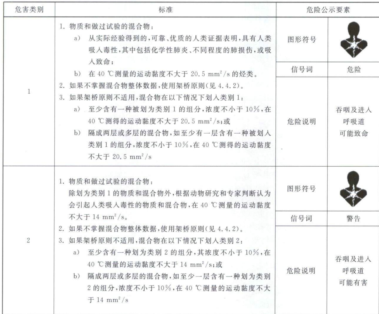
表 D.1 吸入危害分类和标签