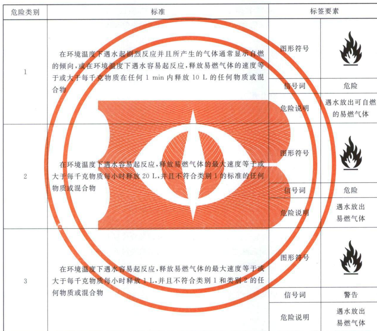
表 C.1 遇水放出易燃气体的物质和混合物分类标准和标签要素