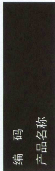
E.1 遇水放出易燃气体的物质和混合物类别 1 和类别 2 标签的示例见图 E.1。