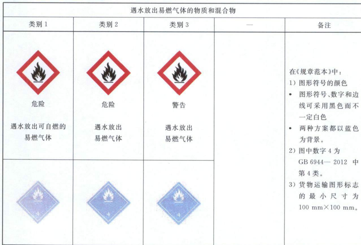
表 B.1 遇水放出易燃气体的物质和混合物标签要素的分配