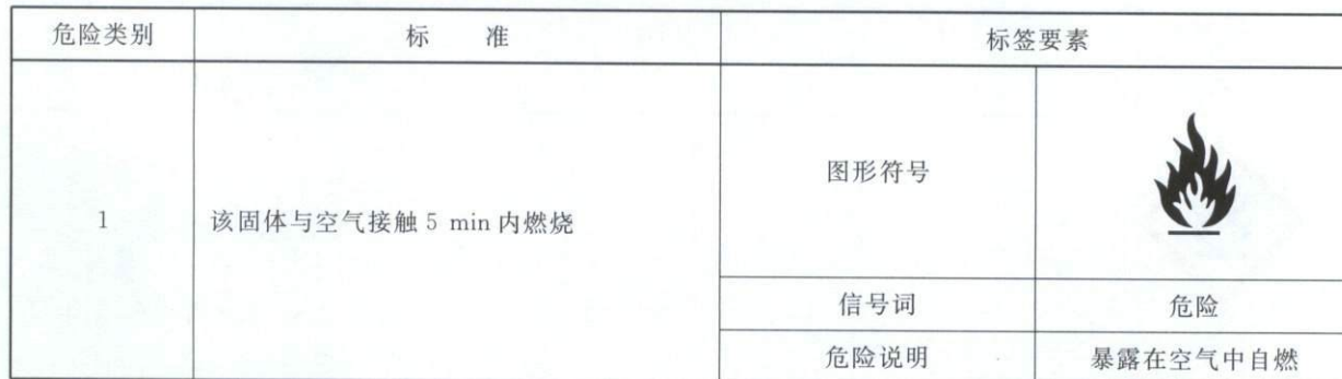
表 C.1 自燃固体分类标准和标签要素