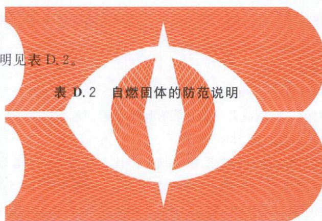
表 D.2 自燃固体的防范说明