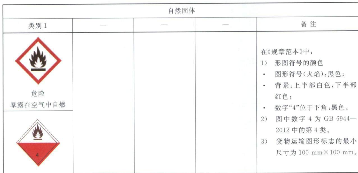
表 B.1 自燃固体标签要素的分配